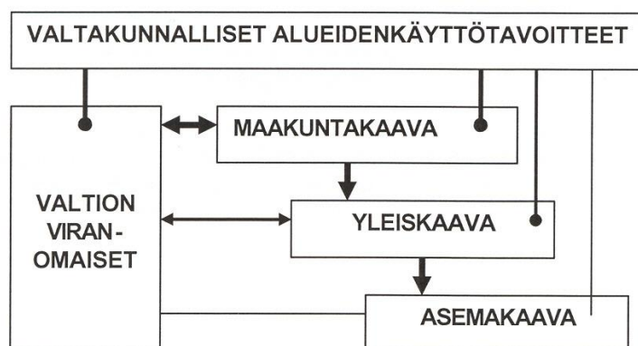
Kuva 2. Valtakunnalliset alueidenkäyttötavoitteet osana maankäyttö- ja rakennuslain mukaista alueidenkäytön suunnittelujärjestelmää.

Valtioneuvosto hyväksyi valtakunnalliset alueidenkäyttötavoitteet maankäyttö- ja rakennuslain perustella vuonna 2000. Valtioneuvosto päätti 13.11.2008 valtakunnallisten alueidenkäyttötavoitteiden tarkistamisesta, muutos tuli voimaan 1.3.2009. Yleiskaavoitustyötä ohjaavat aina ylempi kaavataso eli maakuntakaava, valtakunnalliset alueidenkäyttötavoitteet sekä näiden toteutumista valvovat valtion viranomaiset. Valtakunnalliset alueidenkäyttötavoitteet ovat siis oleellinen osa maankäyttö- ja rakennuslain (MRL) mukaista alueidenkäytön suunnittelujärjestelmää.