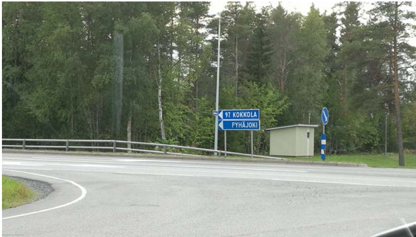
Vihannitien risteys etelään