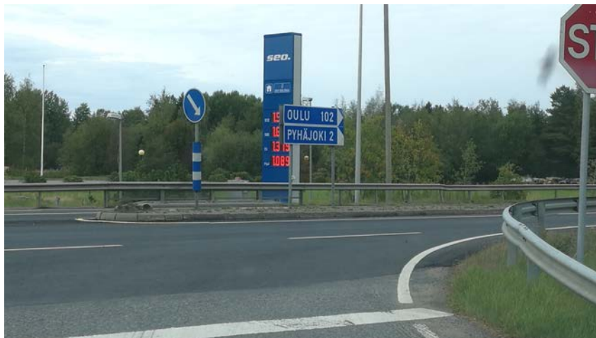
Oulaistentien risteys pohjoiseen