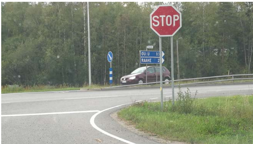
Vihannitien risteys pohjoiseen